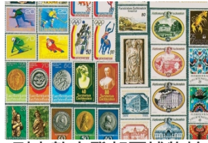
列支敦士登邮票博物馆