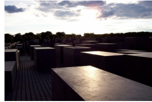
犹太人大屠杀纪念碑群