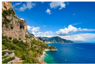
阿马尔菲北部海岸线