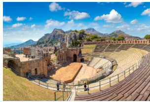
希腊露天圆形剧场