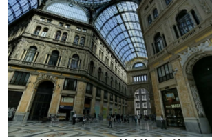
翁贝托一世拱廊街