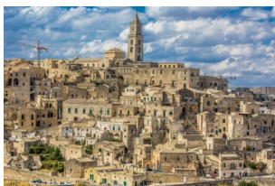
萨西民居和洞穴屋

酒店早餐后，游览历史悠久的马泰拉，参观罗曼式风格的【马泰拉主教座堂】，别具一格的【萨西民居和洞穴屋】。随后游览港口城市【巴里】，并前往被称为“天堂小镇”的阿尔贝罗贝洛，这里以【楚利建筑】闻名于世。踱步于阿尔贝罗贝洛精致的石子路间，一边感受淳朴的意大利小镇民风，一边欣赏古人用智慧堆砌出的艺术。晚上住奥斯图尼或其周边酒店。