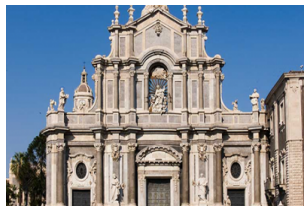
大教堂广场和圣阿加塔大教堂