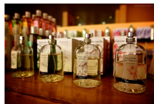
巴黎花宫娜香水博物馆