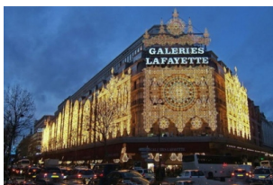
老佛爷百货公司（奥斯曼旗舰店）