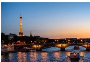
【重点推荐】巴黎夜游