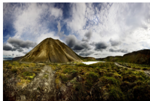
格拉布洛克火山口