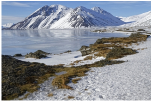
The East Fjords

早餐后从酒店出发，前往欣赏游览【东部峡湾地区】，这里海岸线风景如画、特色鲜明，有历史悠久的渔村、壮丽的自然风光、雄伟的瀑布、火山草甸、崎岖的山脉、壮观的冰川。沿沿途参观【Petra石头博物馆】【鸟蛋】以及闻名遐迩的“白日梦想家小镇”——【塞济斯菲厄泽(Seyðisfjörður)】，坐落于冰岛东部的同名峡湾内，约有668名居民生活在这座“避世”峡湾小镇上，之后驱车前往埃伊尔斯塔济晚上入住埃伊尔斯塔济或附近酒店。