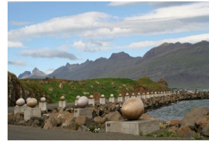
鸟蛋Eggin i Gledivik