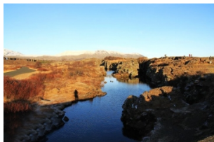
冰岛古议会旧址(露天议会)