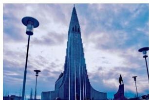
哈尔格林姆斯教堂